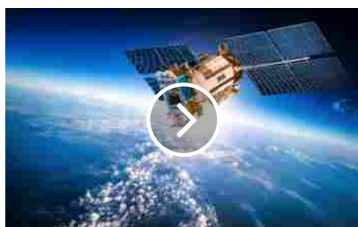
Si conclude il progetto D-DUST: satelliti e modelli predittivi per studiare l'inquinamento causato dalle attività agricole